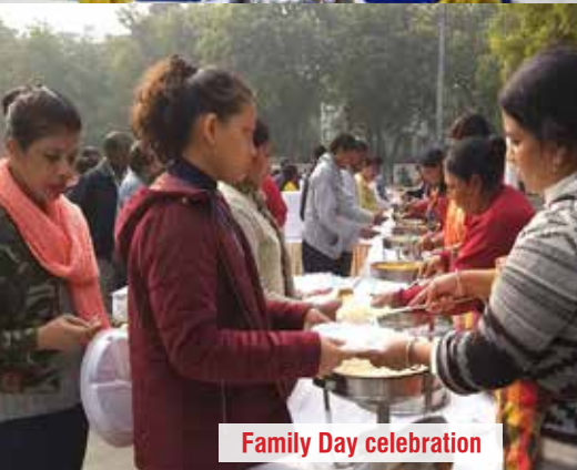
Family Day celebration