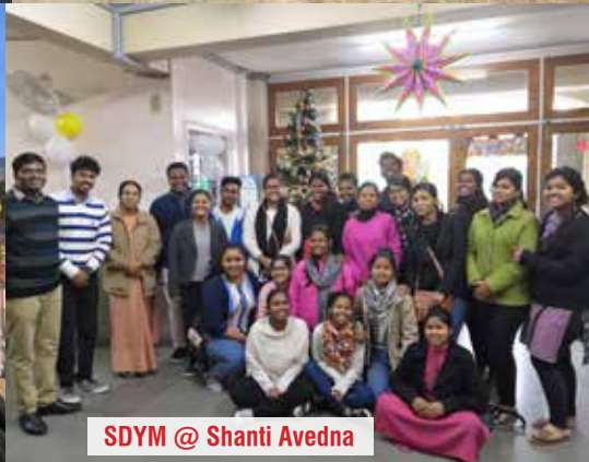
SDYM @ Shanti Avedna