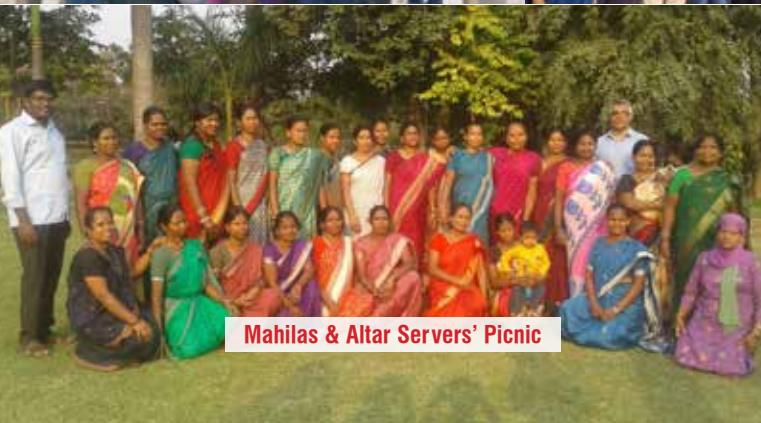
Mahilas & Altar Servers' Picnic