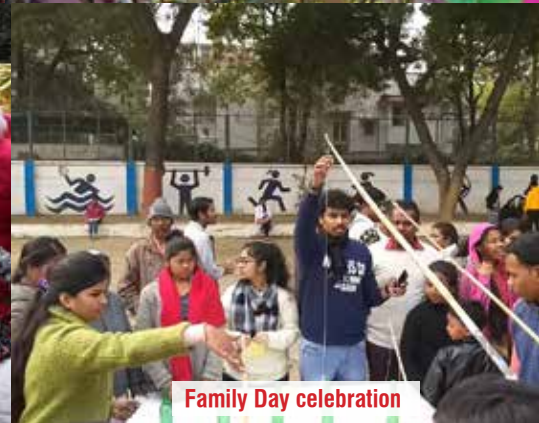
Family Day celebration