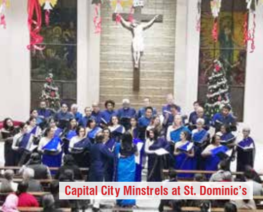
Capital City Minstrels at St. Dominic's