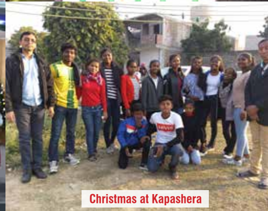
Christmas at Kapashera